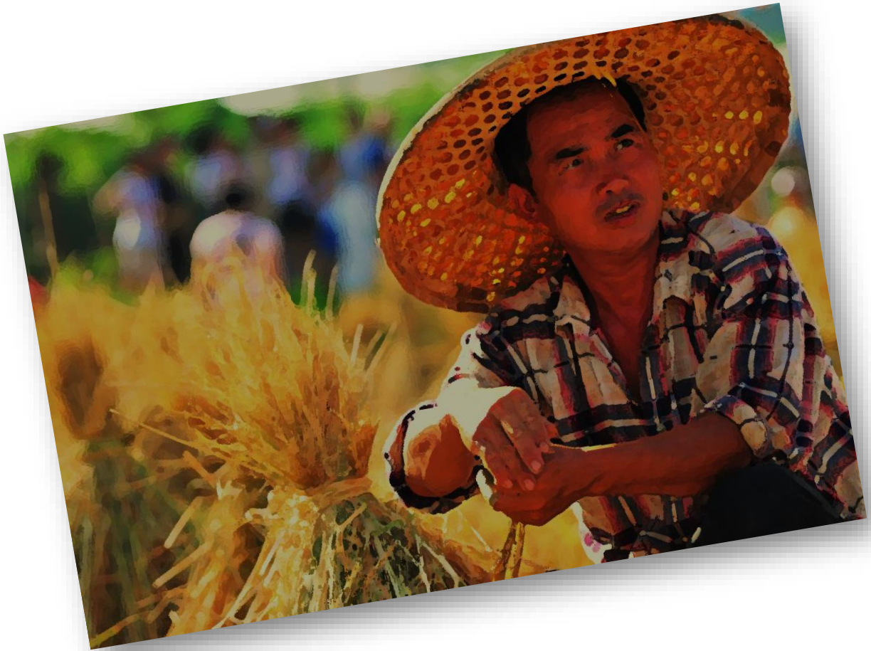
譯自「summer」，並改寫（摘自人智學教育基金會~慈心簡訊）