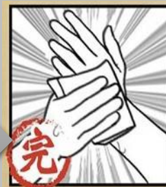
清水沖淨 並擦乾雙手