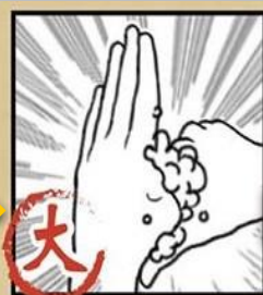
搓揉大拇指 及虎口