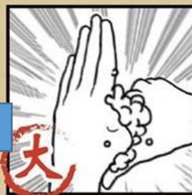
搓揉大拇指 及虎口