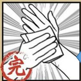
清水沖淨 並擦乾雙手