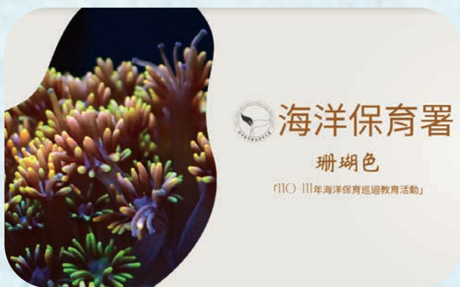
| 珊瑚色 |

入口百寶箱概念以臺灣海岸地形發展，包含藻礁海岸生態系、岩礁生態系、泥灘生態系及珊瑚礁生態系等為架構組合，分為4大區塊，再搭配各區域常見之海洋生物，帶你一窺我們的海洋。