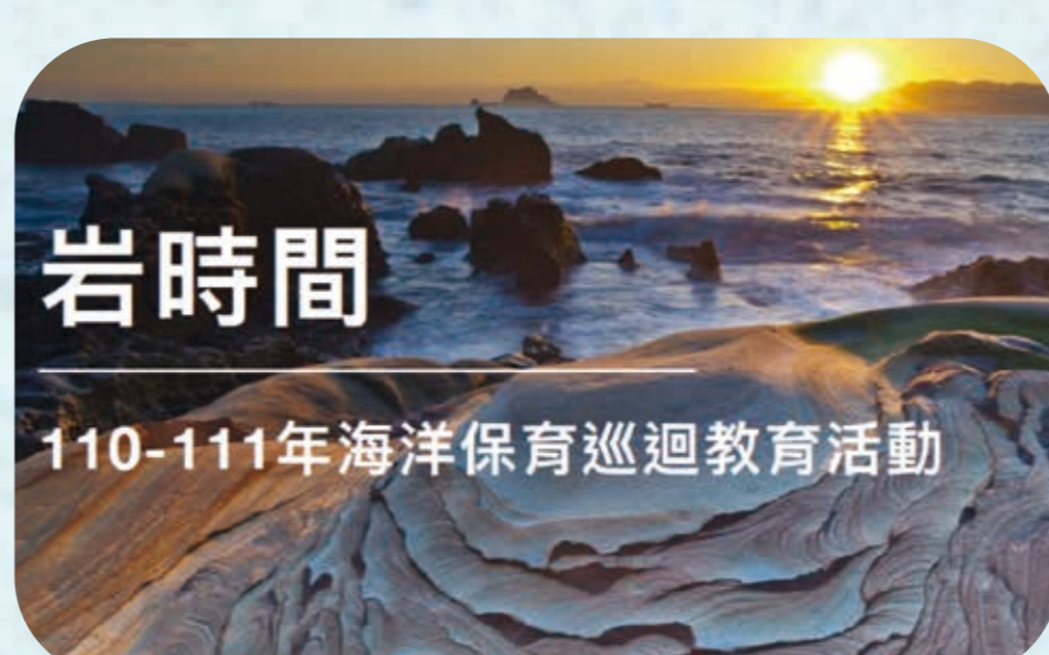
| 岩時間 |