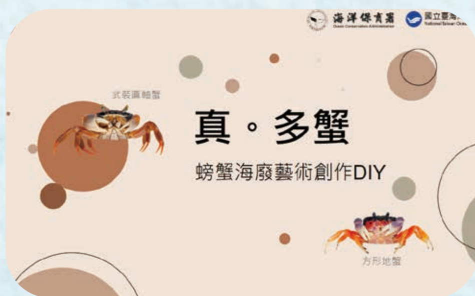
| 蟹蟹泥 |